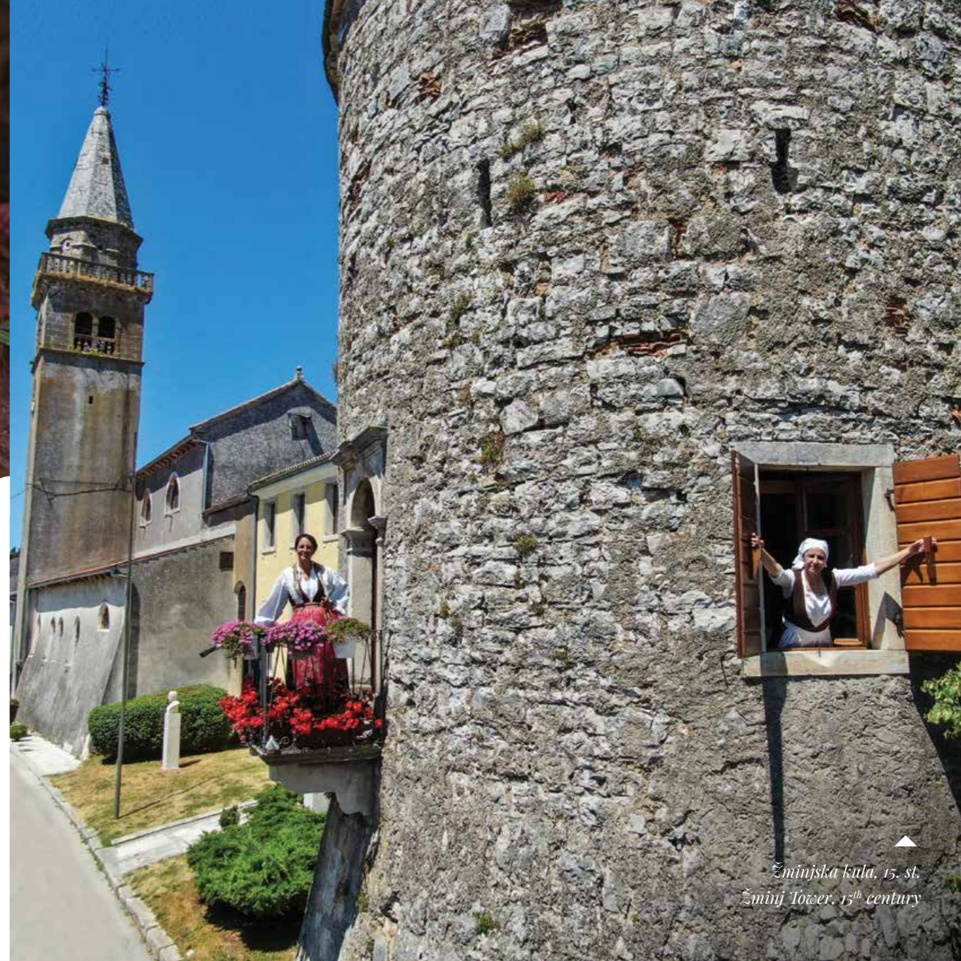
Žminjska kula, 15. st. Žminj Tower, 15th century

+385 (0)91 561 6327 info@sig.hr www.sig.hr Špijla Feštinsko Kraljevstvo