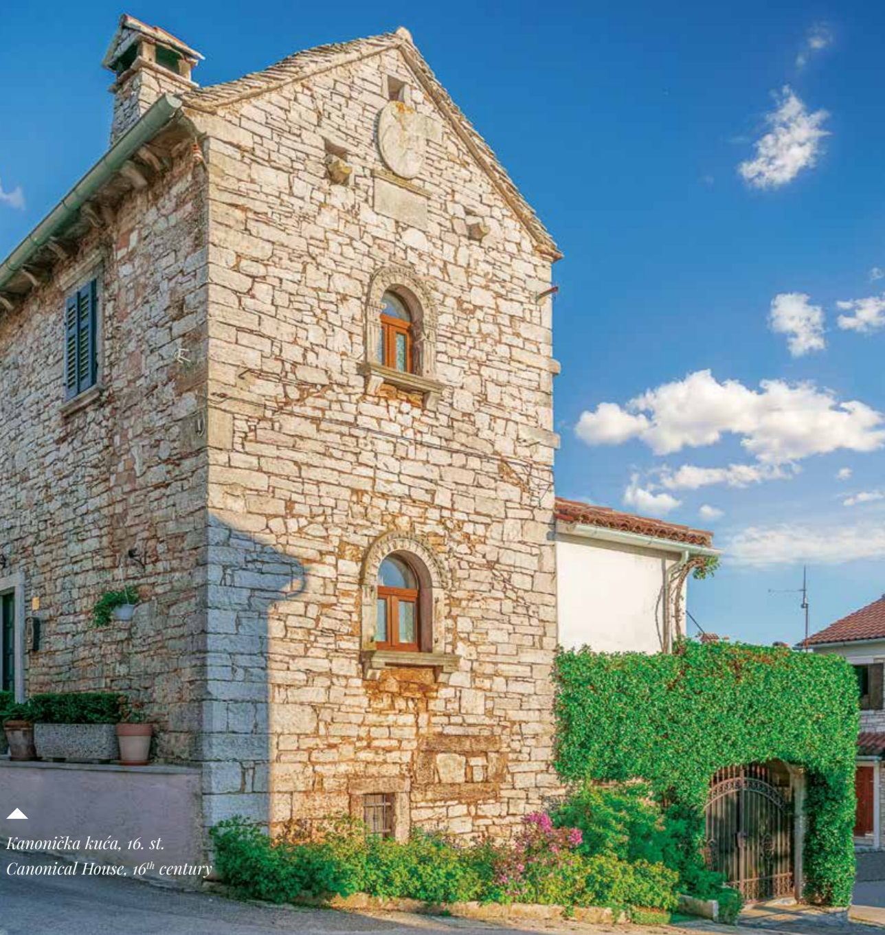
Kanonička kuća, 16. st. Canonical House, 16th century